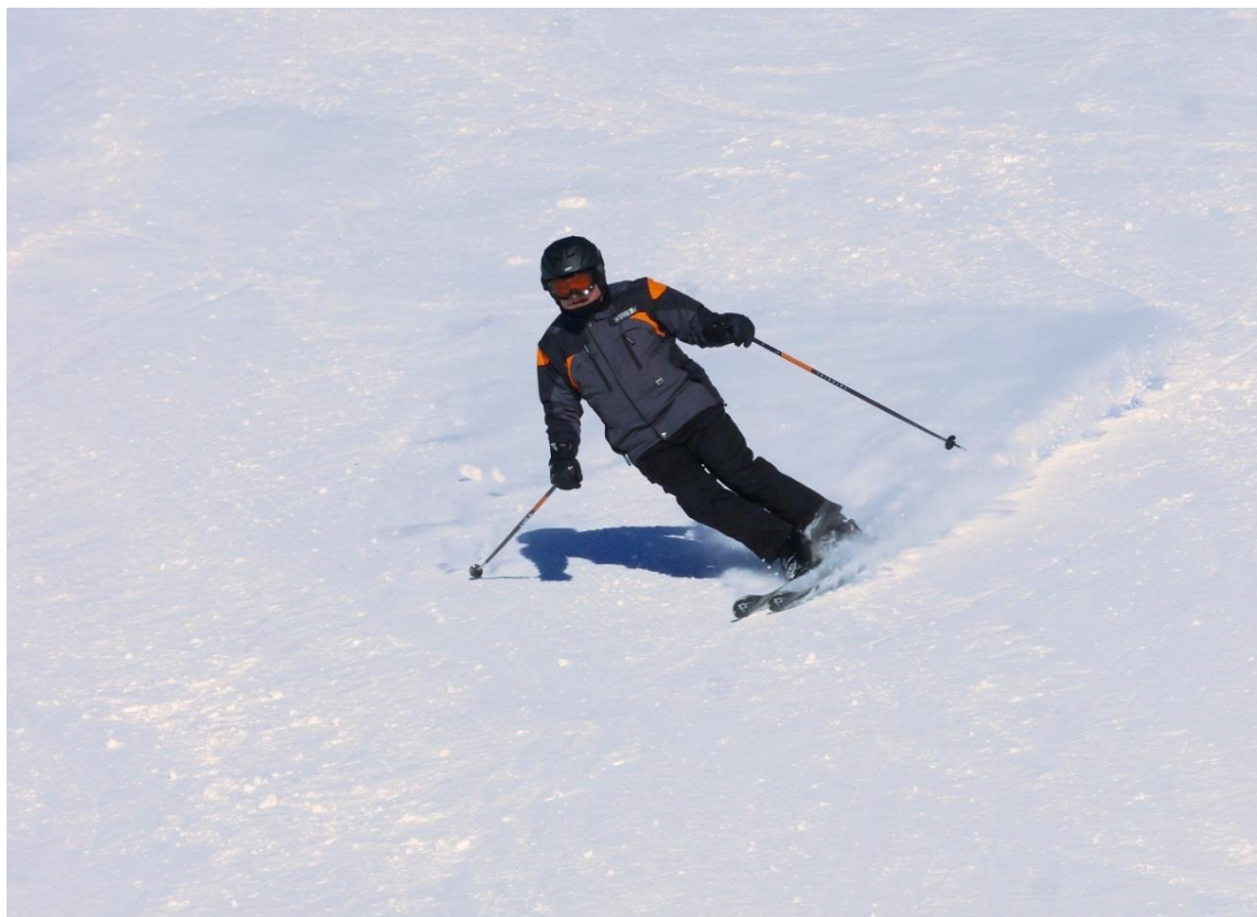
Pegas vždy elegantní

....ale nám to nevadilo a jezdili jsme jako pánibozi