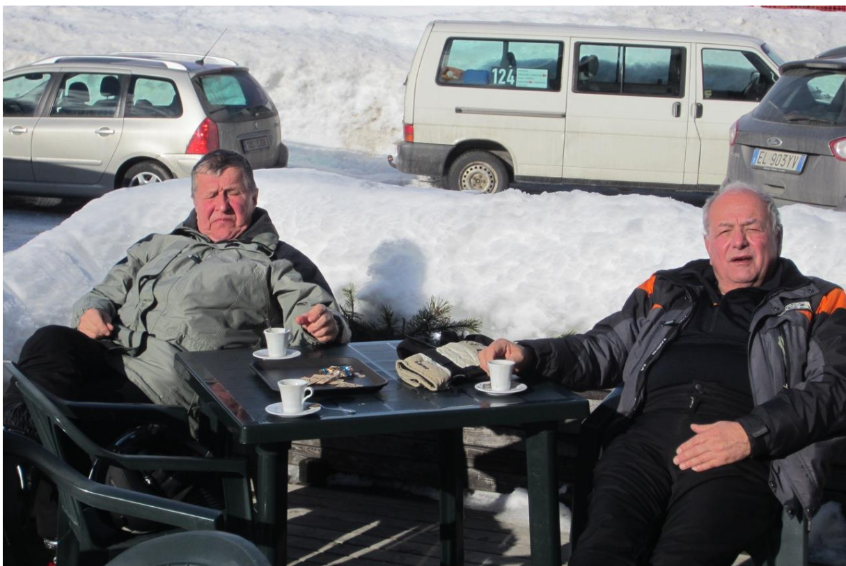
... a u kařička, pŕed našim pensionem.