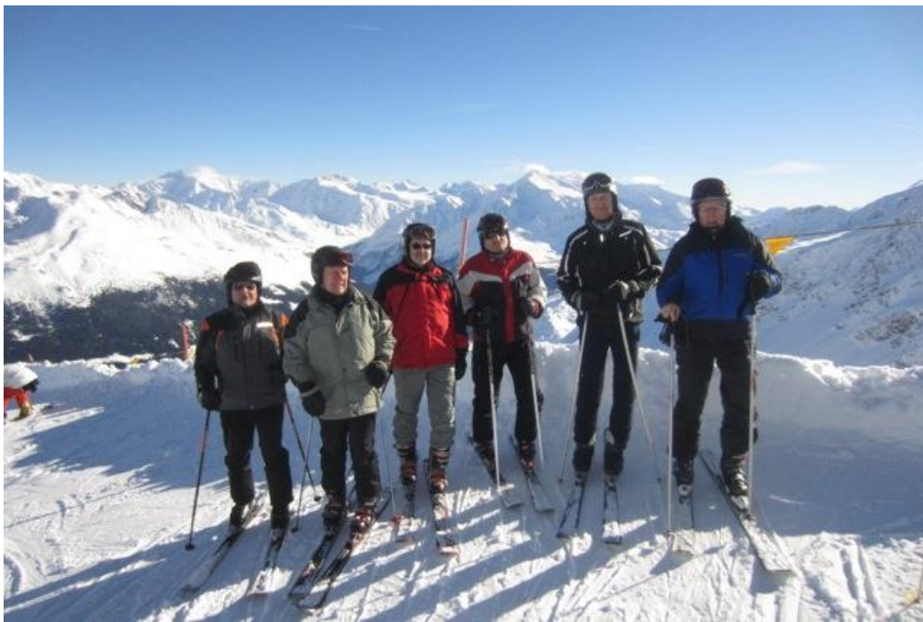
Pohledy z vrcholu