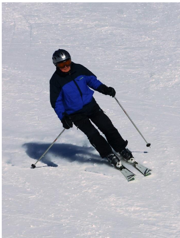
Plavec si to opravdu užíval