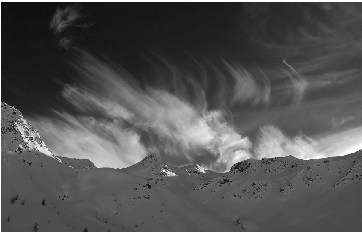
Bylo větrno a zima...

....ale nám to nevadilo a jezdili jsme jako pánibozi