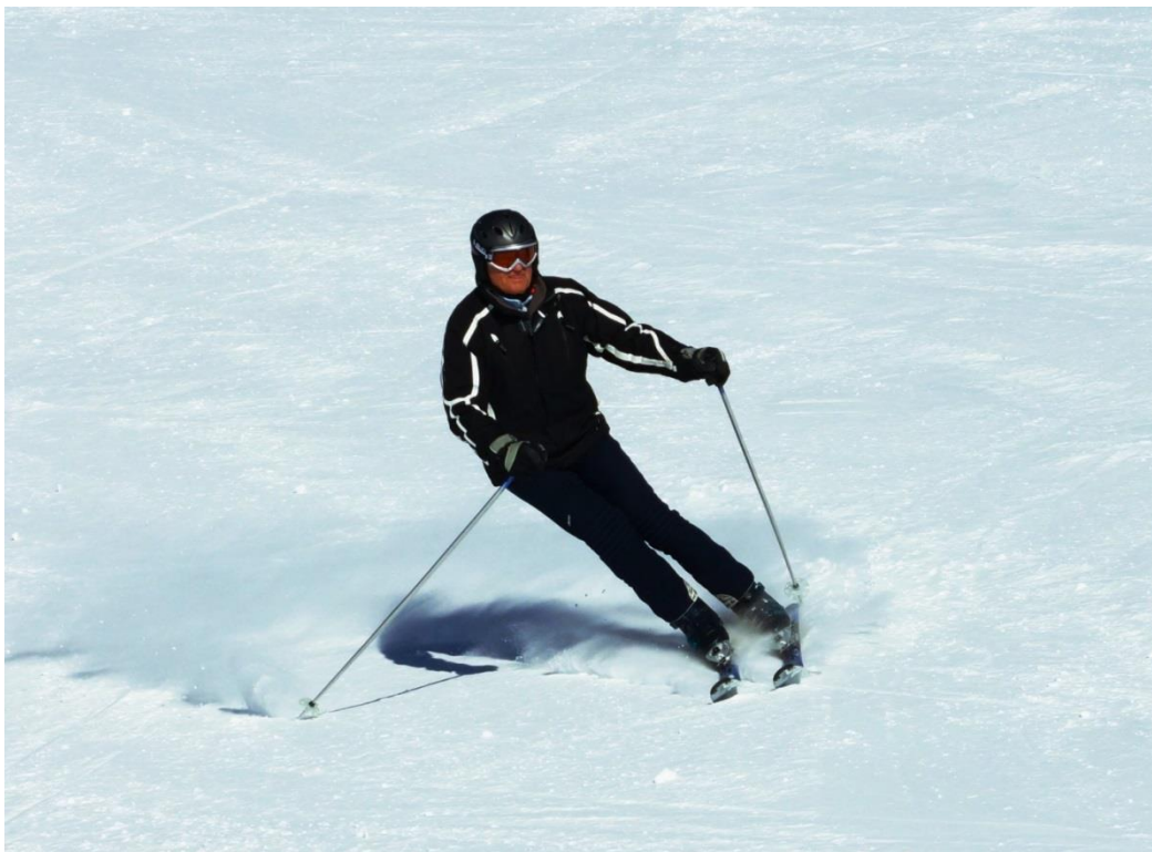
Pacík s nohami štafj kvůli artróze.