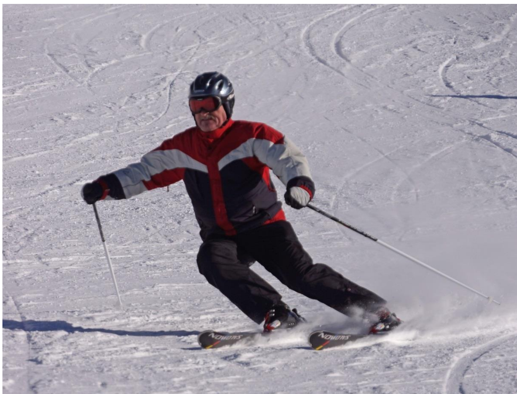
Yško vždy nejrychleší