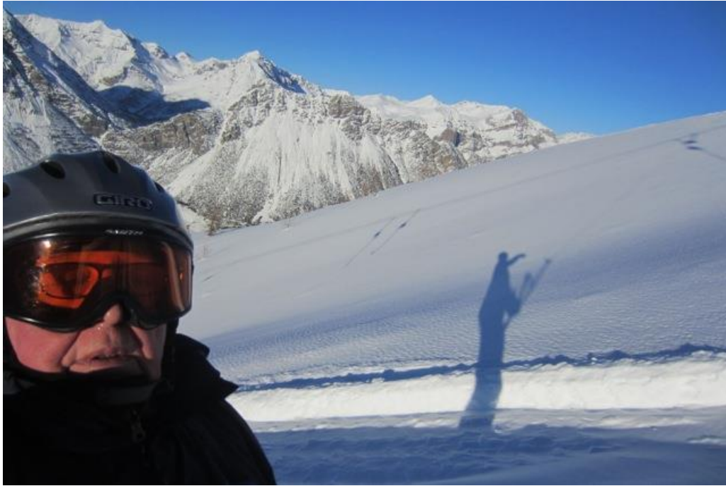
Na vrcholcích bylo krásně, ale zima a někdy větrno